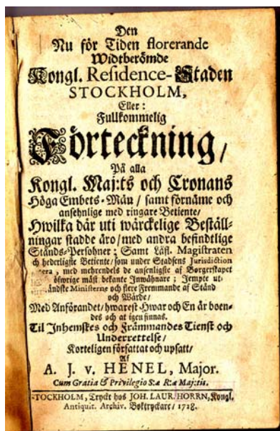
Den nu för tiden florerande...