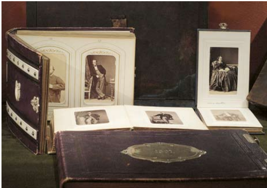
Många album för visitkort var påkostade och mycket rikt utsmyckade. De skulle få en hedersplats i salongen, ett slags motsvarighet till dagens bildrika coffee table-böcker. Albumen kunde köpas helt fyllda med visitkort av kungligheter och celebriteter, halvt fyllda för egen komplettering, eller helt tomma där man satte in sina egna visitkort. I albumen rådde hierarkisk ordning; kungligheter och viktiga bekantskaper man ville skryta med kom först.