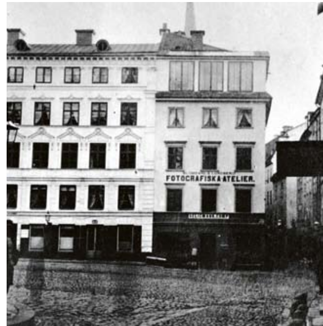
Ovan: Wilhelm Lundbergs ateljé vid Stortorget, ingång Skomakargatan 1. Ateljén låg längst upp i huset, med takfönster och stora fönster mot norr för en jämn belysning.