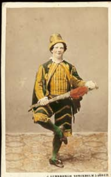
J. LUNDBERGH STOCKHOLM & SÖDER