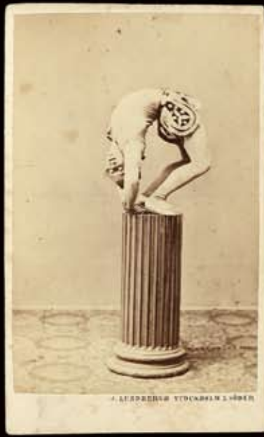
J. LUNDBERGH STOCKHOLM & SÖDER