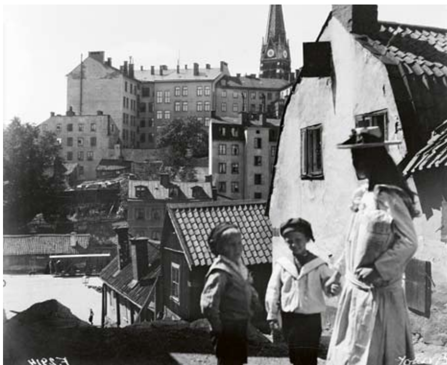
Några barn står i Iversons gränd, nu Iversonsgatan. Nedanför trapporna västerut ligger Roslagstorg. I bakgrunden syns kvarteren Såpsjudaren och Höjden. Johannes kyrkas torn sticker upp i fonden. Huset till höger revs 1911. Där Roslagstorg låg går nu Birger Jarlsgatan.

Men samlingen är också intressant för att Salin var just amatörfotograf.