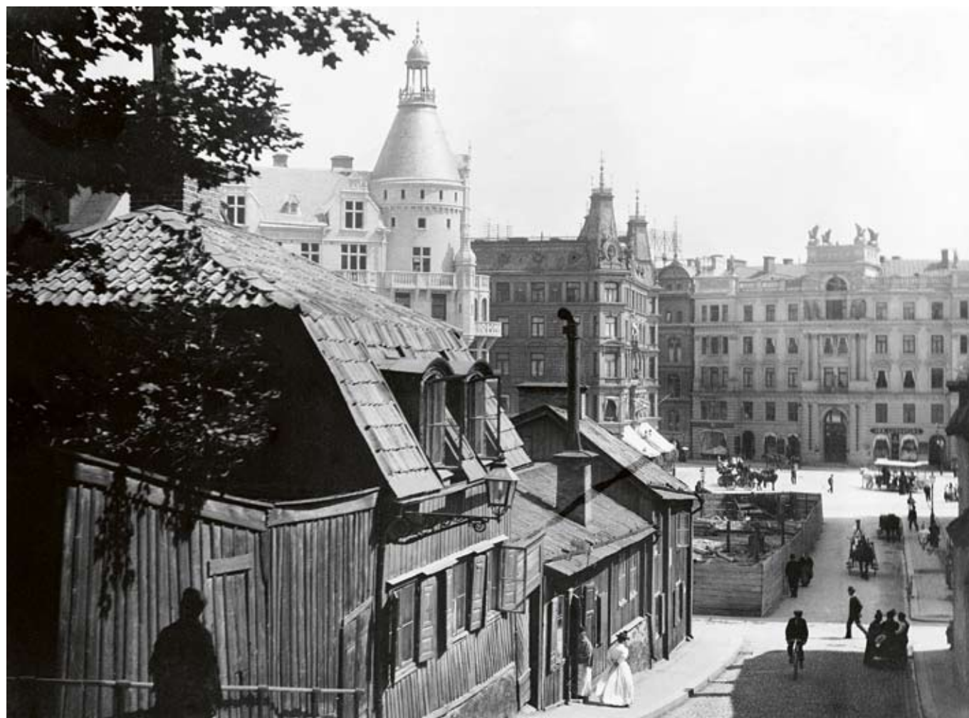
Lutternsgatan österut kring sekelskiftet 1900. Gatan korsar Norrlandsgatan samt Biblioteksgatan och slutar vid Stureplan. Trähusen som står inför rivning ligger vid Lutternsgatan 8 och 10 i kvarteret Kåkenhusen. I fonden ligger Stureplan 6, nu Sturegallerian. Vid Stureplan 4 öppnades Sturebadet 1885. 1905–1911 utschaktades Lutternsgatan genom Brunkebergsåsen och fick namnet Kungsgatan.