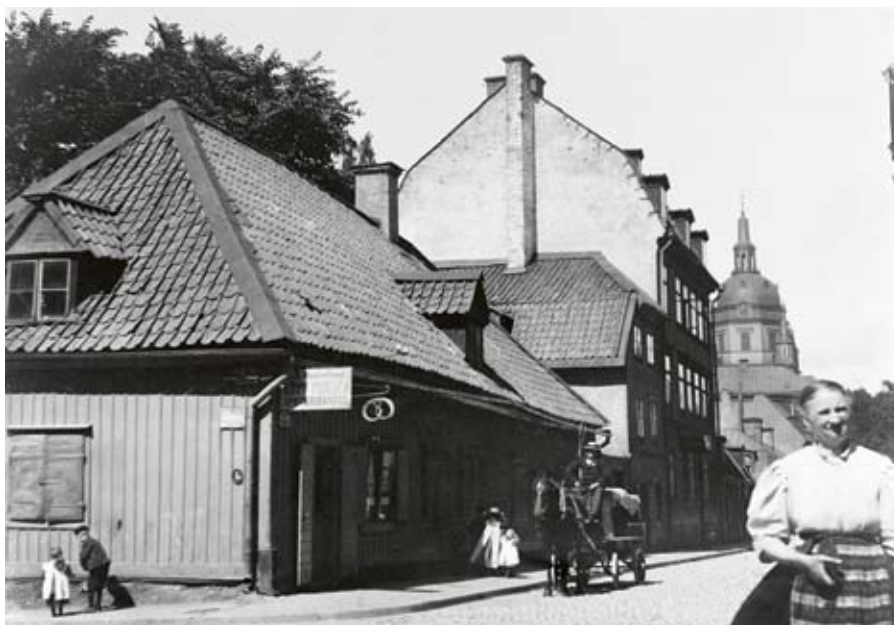
Södermannagatan norrut från Kocksgatan med Katarina kyrka i fonden. En specerihandel ligger vid Södermannagatan 10 i kvarteret Båtsmannen större. Kasper Salin har fångat det dagliga folklivet på gatan med barnen, hästfordonet och kvinnan som passerar.

Fotografierna är inte så välkomponerade och redigerade som vi är vana att fotografier från hans samtid är. Tvärtom känns de spontana och det vardagliga livet finns med överallt; sotare klättrar på skorstenar, barnen leker barfota på gatorna och kvinnor lyfter sina kjolar för att inte dra dem i vattenpussarna.