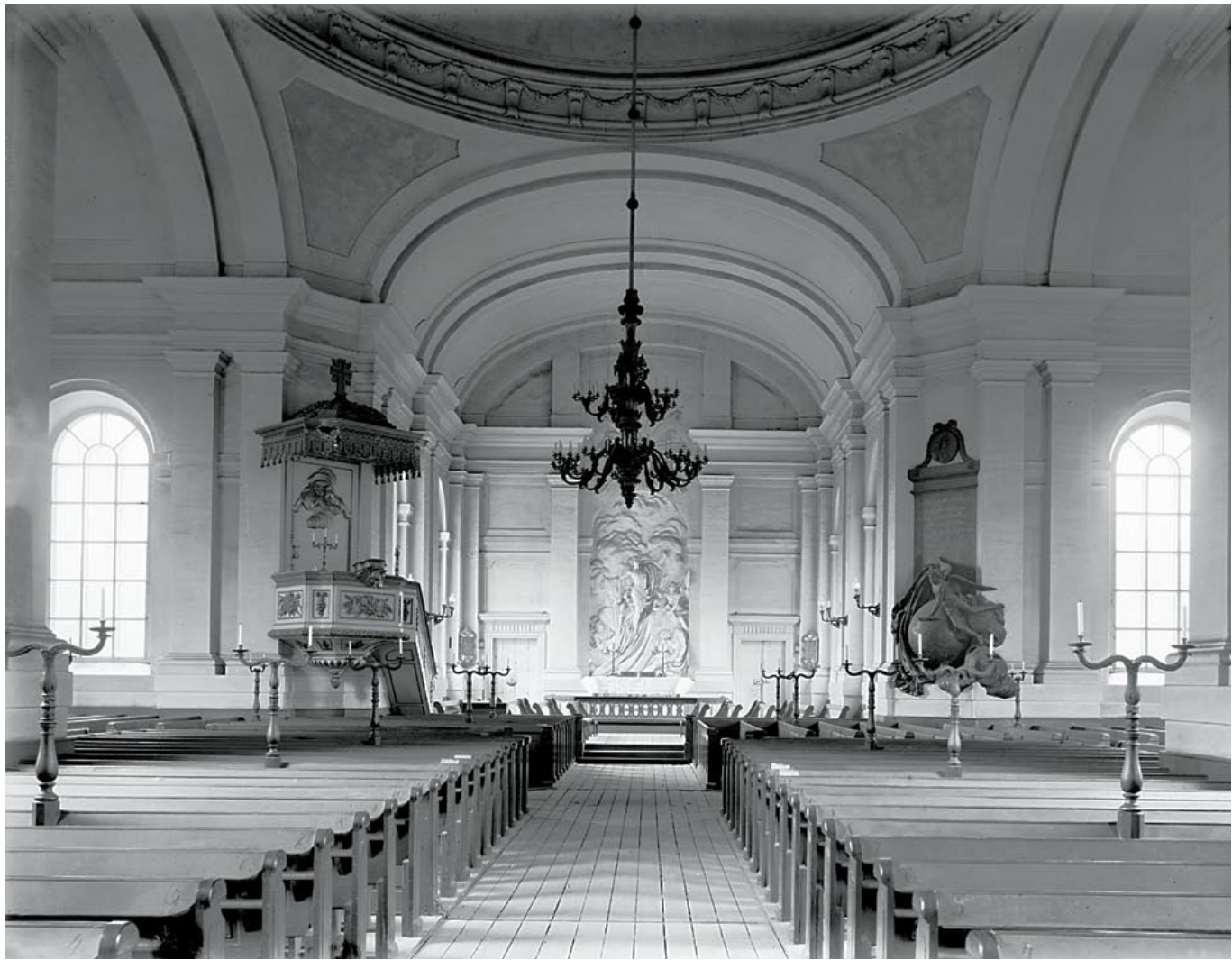
Kyrkorummet mot koret före 1893. I fonsen syns altarreliefen och till höger epitafiet över René Descartes, båda utförda av Tobias Sergel. Predikstolen är ritad av Adelcrantz medan ljushållarna i bänkkvarteren göts av kapellets