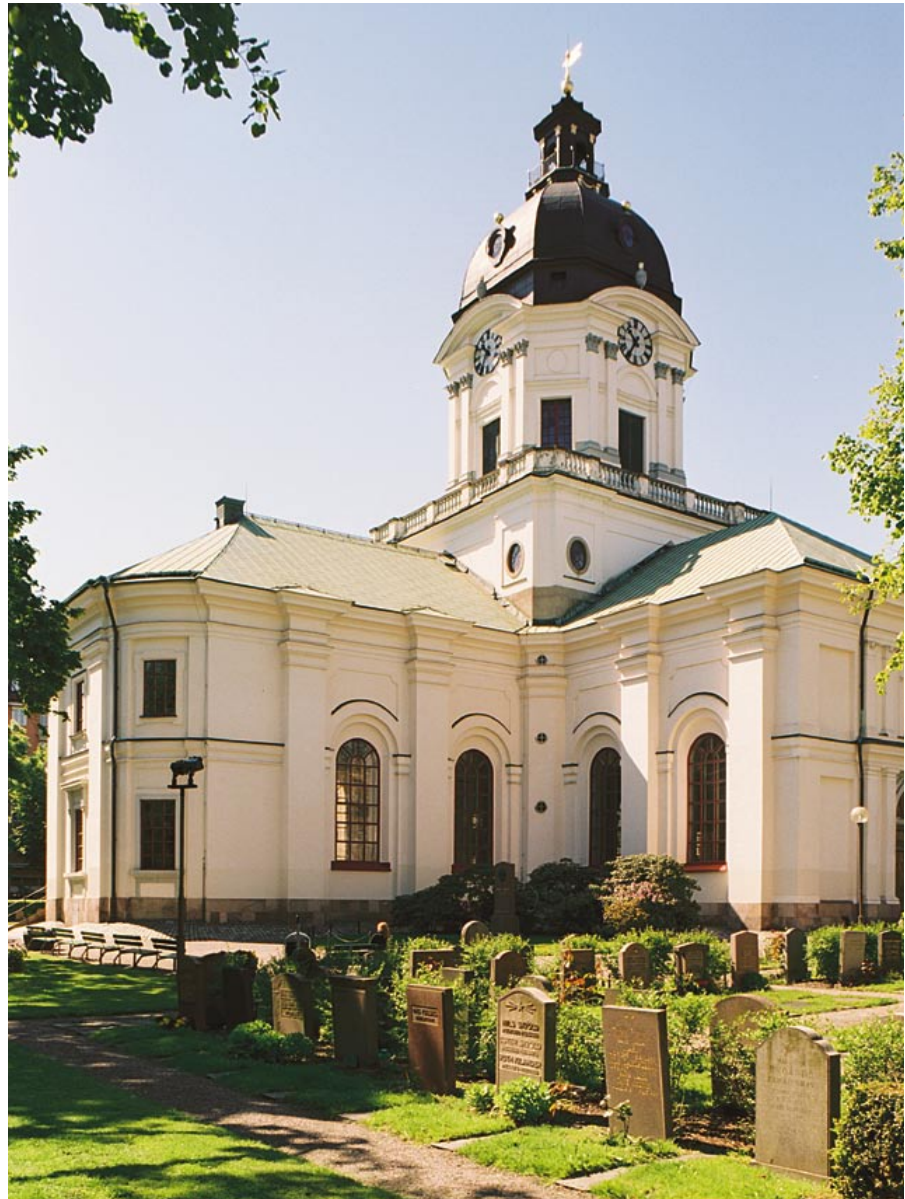
Adolf Fredriks kyrka från nordost. Kyrkogården har förminskats vid olika tillfällen. Idag ligger gravar i strikt formade kvarter till skillnad från 1800-talets mer slingrande gångar och rika vegetation. År 1864 planterades fyra lindalléer, 55 pyramidpopplar, 55 pilar, 465 syrener, 35 lärkgranar, 525 mindre träd och buskar, 8 pyramidalmar, 4 hängaskar, 170 törnrosor samt en berberishäck.

Kyrkans exteriör såg i stort sett ut som idag med ljusstutsade fasader, stramt klassicistiskt indelade av pilastrar och rundbågiga fönster. Huvudingången i väster markeras av en portal med