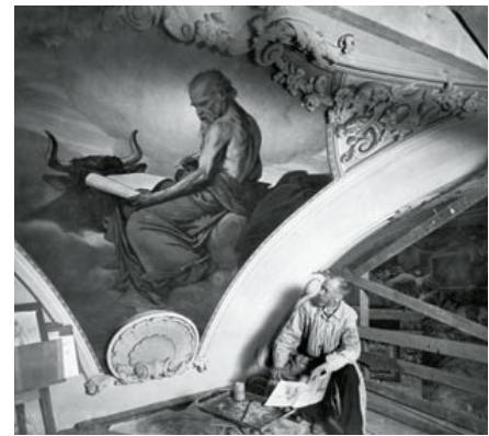
Konstnären Julius Kronberg målar en av evangelisterna i ett av fälten direkt under kupolen i Adolf Fredriks kyrka. Målningarna finansierades av fabriker Knut Ljunglöf och utfördes 1899–1900. Foto: 1900. Stockholms stadsmuseums samlingar.

och kupolen målades 1900 med bibliska motiv. På 1950-talet var det dags för nästa genomgripande renovering. Vi den här tiden stod inte det sena 1800-talets formspråk högt i kurs och i Stockholm hade mycket av 1800-tals-