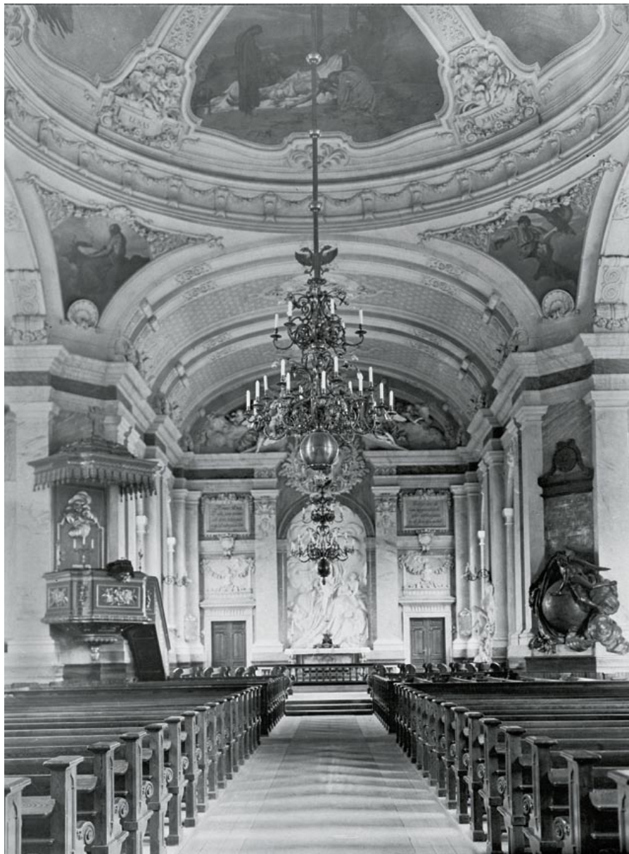
Kyrkorummet mot koret efter 1890-talets renovering av Agi Lindegren. Förutom all ny stuckdekor och dekormåleri på väggar och i valv tillverkades bl.a. nya bänkar. Ljuskronan från 1860-talet i kupolens mitt byttes mot fyra ljuskronor och predikstolen målades om. Foto: G. Heurlin, 1926. Stockholms stadsmuseums samlingar.

ledde det istället till en totalomvandling av rummets dekorativa gestaltning. Nu skulle interiören få den prakt som Adelcrantz enligt Lindegren inte haft ekonomiska resurser till. Hela rummet kläddes 1893–1895 med stuckornament