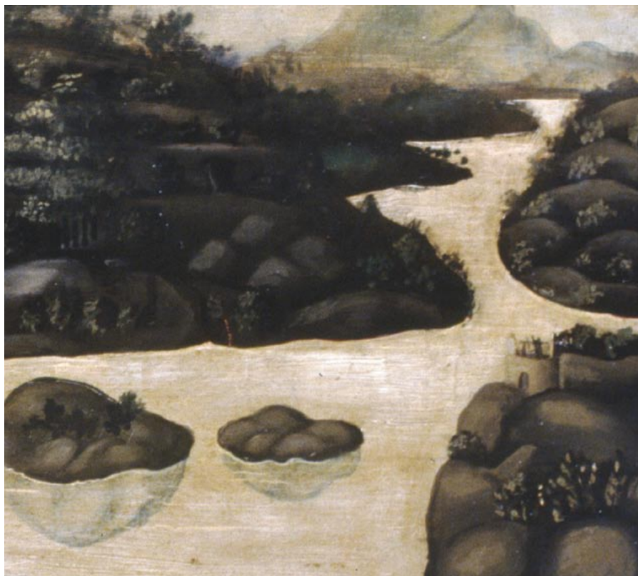
Galgen på Stigberget. Detalj från Vädersolstavlan, oljemålning från 1636 av Jacob Elbfas, kopia av ett försvunnet original från 1535.

tag efter att de bråkat om en gammal ölskuld. Han döms till att mista huvudet. Hustruns bror nekades efter detta att bli ny bödel. Änkan bor kvar i stugan och har två inneboende, en soldat och en kvinna. De lockar vid tre tillfällen in grisar från gatan för att ha till mat. För detta brott döms änkan att packa sig ut ur staden.