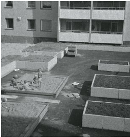
»Lekdäck« kallades lekplatserna ovanpå garagen mellan husen.

byggas på 10 år var tanken att lösa den brännande politiska fråga som bostadsbristen innebar i mitten på 1960-talet. För att detta skulle bli möjligt och för att hålla priserna nere gällde det att ta till nya sätt att bygga hus. Byggandet industrialiserades och nya standardiserade byggnadsdelar och material togs i anspråk. Bostadsstandarden var låg både vad det gällde modern standard och utrymme att tillgå för varje familjemedlem. Men det var inte bara att få en modern rymlig lägenhet som var det viktiga för många människor utan att överhuvudtaget få en lägenhet.