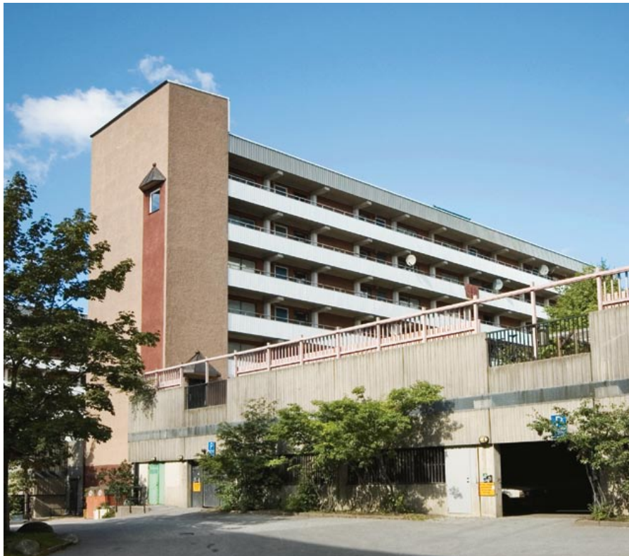
Kämpingebacken 13 i slutet på augusti 2006.