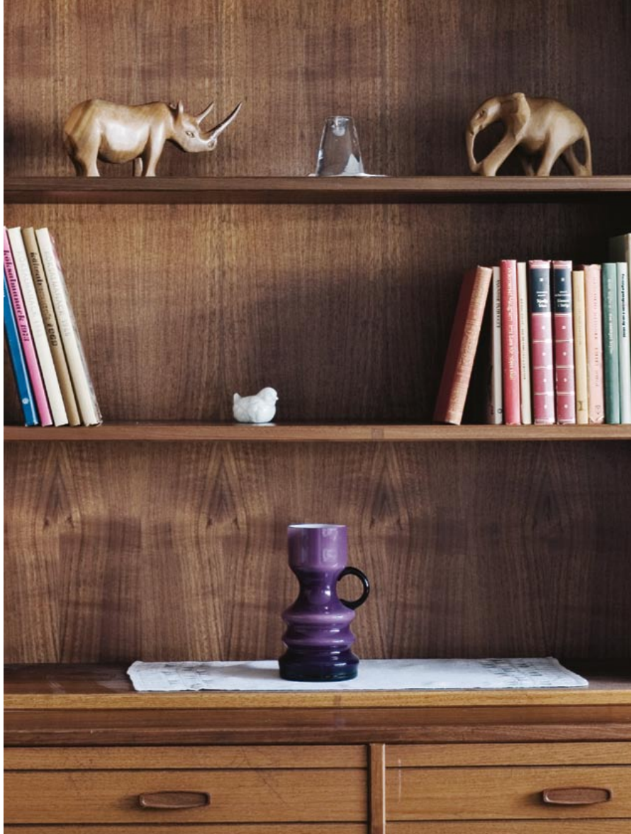
Bokhyllan i vardagsrummet hade plats för både böcker och prydnadssaker.

stationshus därnere och så fick man åka med något skraltigt gammalt tåg.»