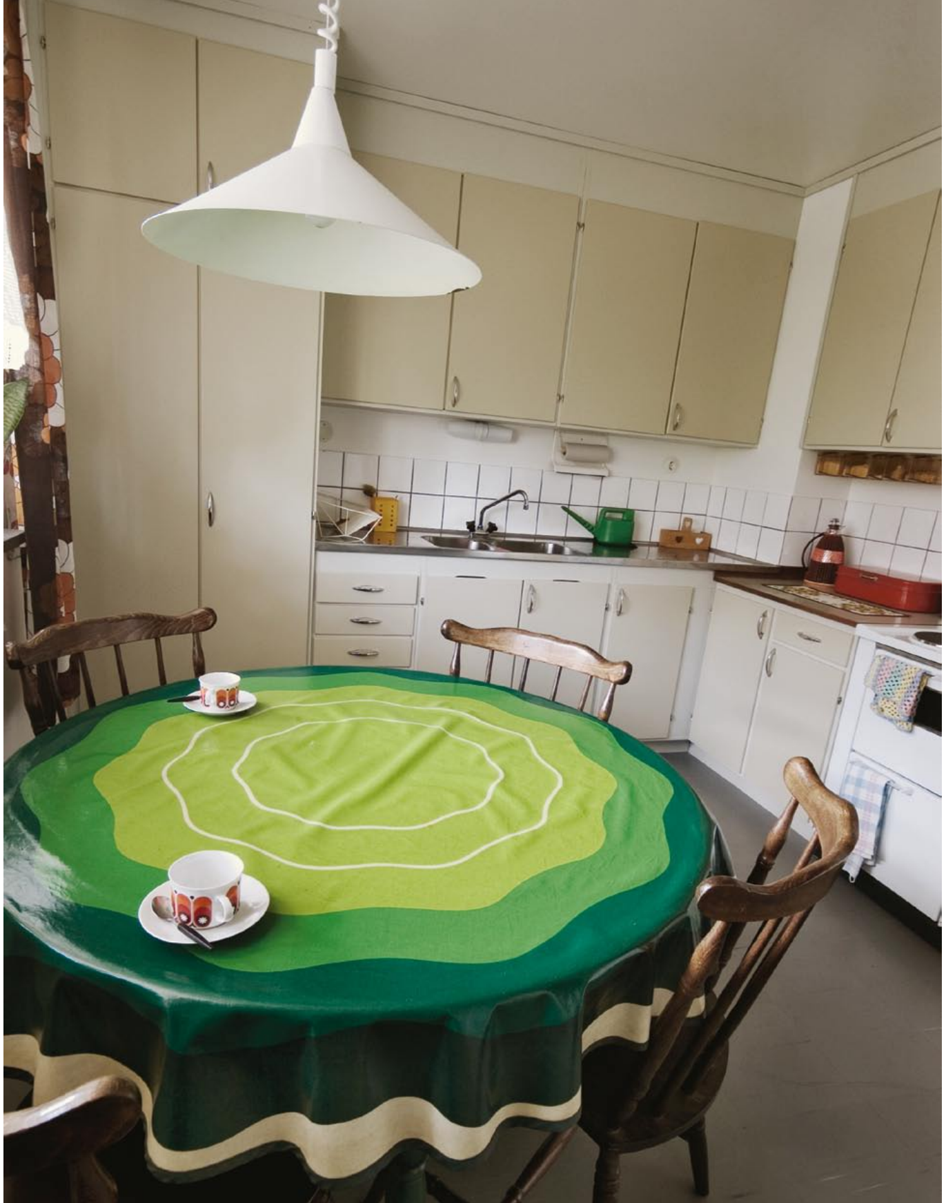
Köket var stort, ljust och rymligt med fönster ut mot loftgången. Spis med fyra plattor och kylskåp med frysack var modern standard.