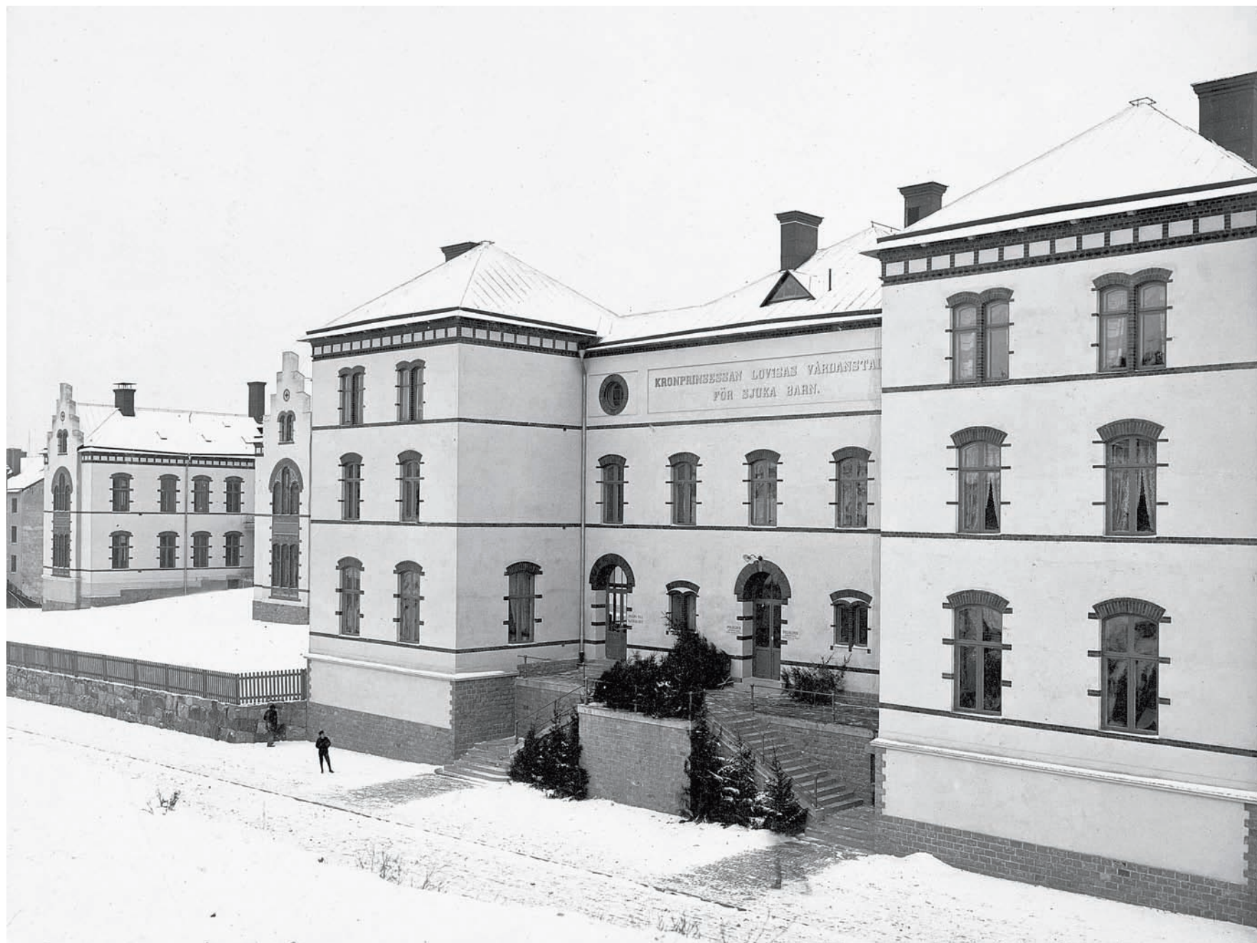
Kronprinsessan Lovisas barnsjukhus, 1899–1970, arkitekt Axel Kumlien, SSM.