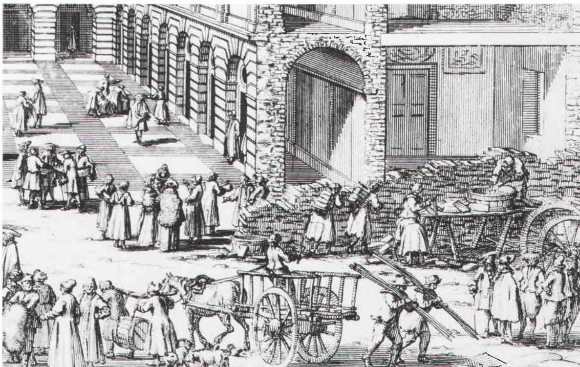
Ryska pälshandlare i fotsida rockar och andra köpmän inbegripna i en livlig affärsverksamhet. Till höger ses vindragare, järnbärare och mursäckor i arbete. Detalj ur Swiddes kopparstick från 1691. SSM.

vuxit till 74, ett tecken på att affärerna blomstrade. Handeln skedde i parti med hjälp av edsvuren tolk och till de varor som utbjöds hörde olika slags pälskinn, lin, lärft och hampa. Endast vissa saker, som sadlar, remtyg, stövlar och ryska piskor, fick säljas över disk.