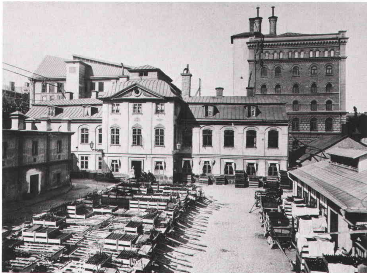
St Eriks bryggeri vid Kungsholmstorg på 1890-talet.

den var vacker! Det var en utställning! Man kunde inte se sig mått!