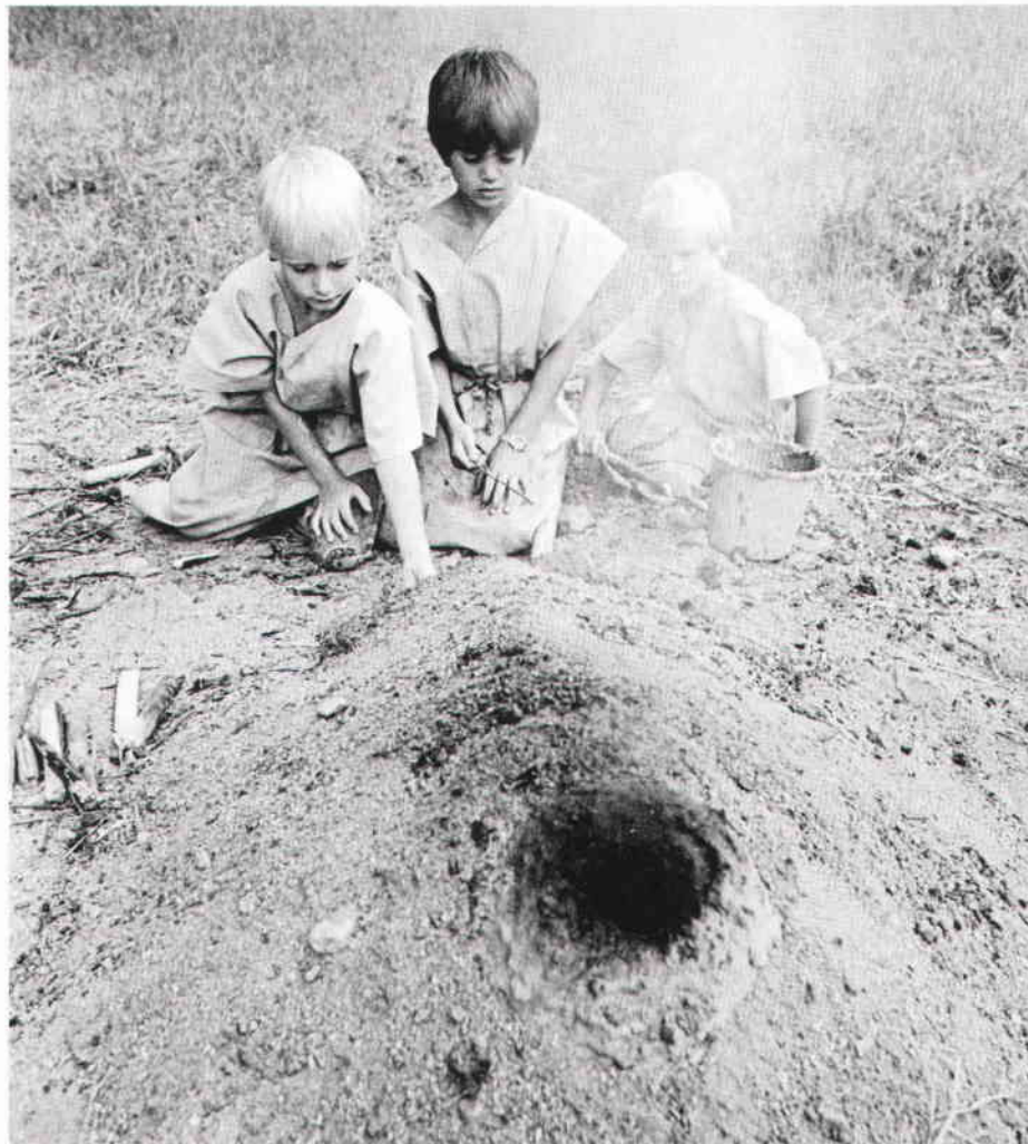
Elden i ugnen fick inte slockna. Det gällde att ständigt lägga in vedpinnar.

I keramikgruppen tillverkades skålar till hushållet. Alla fick var sin klump lera och tummade eller ringade upp de olika kärlen. Skålarna ställdes på tork och efter en tid kunde de brännas. Vissa dagar brände vi i grop. Skålarna lades i en grop och täcktes över med kottar och kol. Ovanpå gjordes en liten eld som sedan sakta fick växa till ett kraftigt bål. Man nådde på bara några timmar upp i ganska hög temperatur. Vi brände också i en ugn. Det var en s k Hasserisugn, en rekonstruktion av en ugn från 500-talet. Skålarna placerades långt in i ugnen på en avsats. Under avsatsen