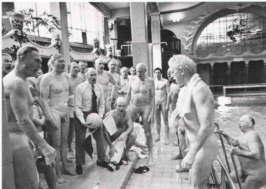
Morgonbadarklubben utbringar ett leve för Centralbadet 1974.