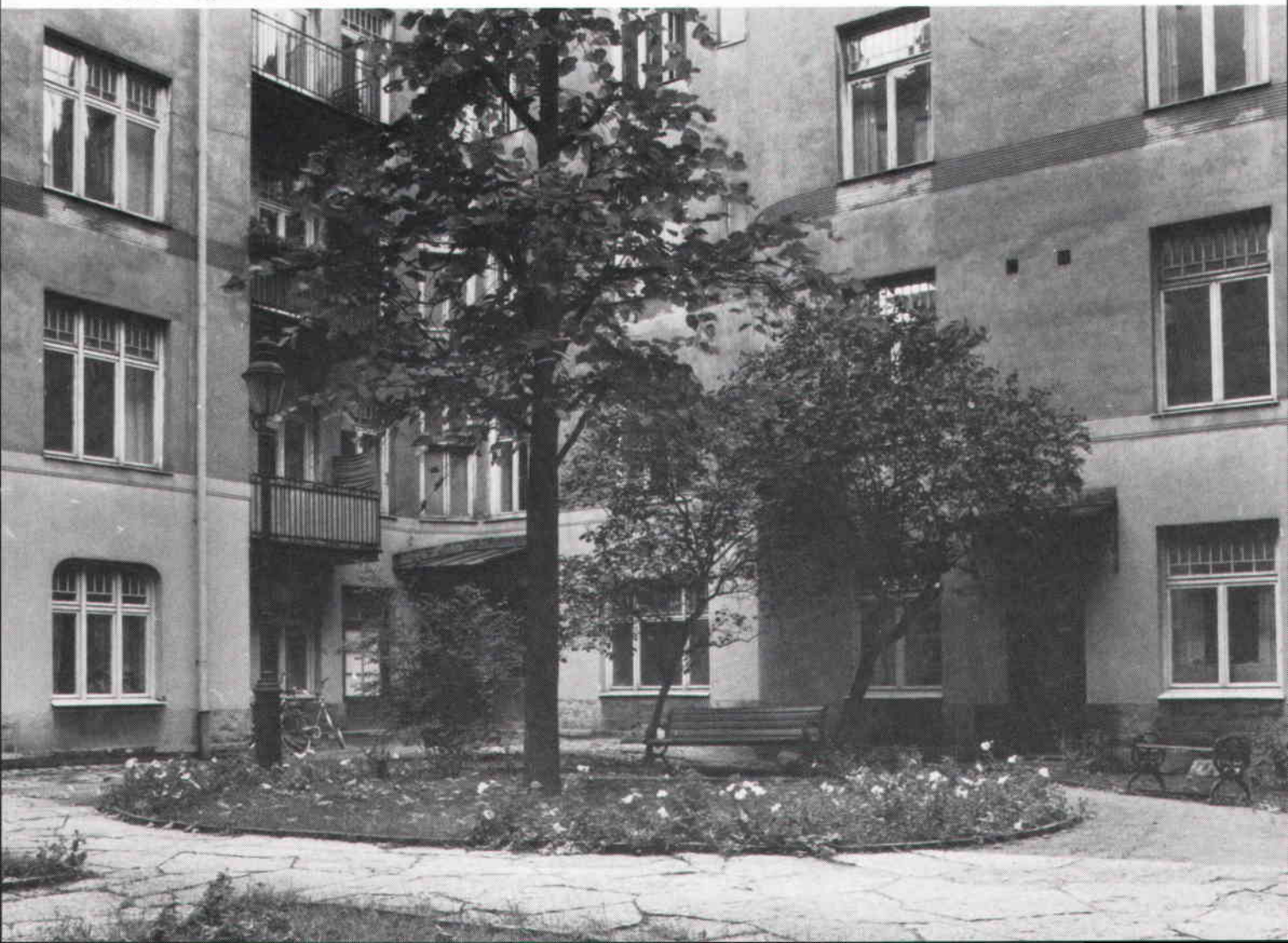
Gård, Skeppargatan 27 (Havssvalget 20). Huset uppfört 1904—05.

Stadsarkivets ritningssamling sträcker sig bakåt till 1713, men uppvisar under 1700-talet luckor och de ritningar som finns kan vara svårtolkade eller är bristfälliga. När en 1600-, 1700- eller en tidig 1800-talsbyggnad är aktuell för inventering, är en djupare arkivundersökning nödvändig. Vi är i Stockholm lyckliga nog att ha ett väl bevarat och dessutom lättarbetat arkiv i Stockholms stads