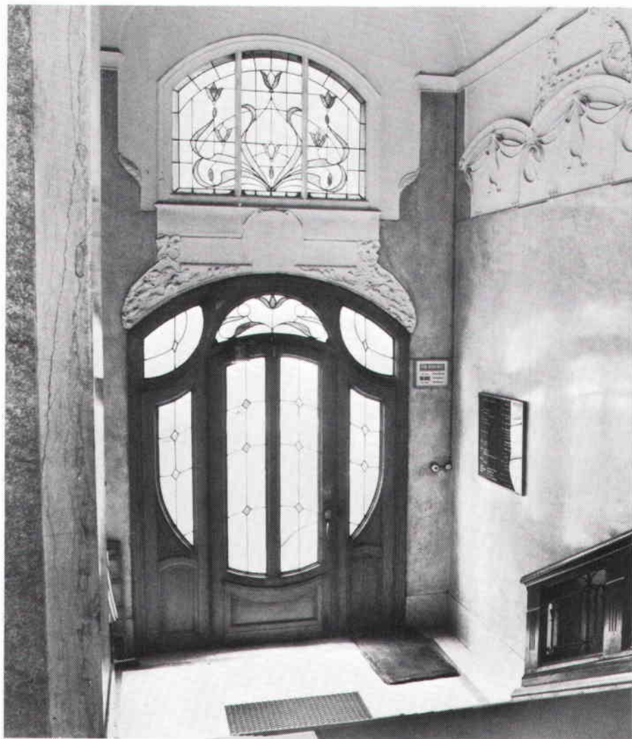
Entré i jugendutformning, Wallingatan 37 (Läraren 8). Huset uppfört 1905—07.

Nästa moment är ett besök i byggnadsnämndens ritningsarkiv i Tekniska nämndhuset för att studera byggnadslovsritningar och andra handlingar från tiden då huset byggdes. Dessutom genomgås alla ombyggnadsärenden, som belyser fastighetens byggnadshistoria. Handlingar från tiden före 1875 finner man på Stockholms stadsarkiv på Kungsklippan. Vid besöken i dessa arkiv antecknas på blanketten uppgifterna om arkitekt, byggherre och byggmästare — dessa kan vara svåra att nå, i synnerhet vad gäller det äldre materialet. Dess-