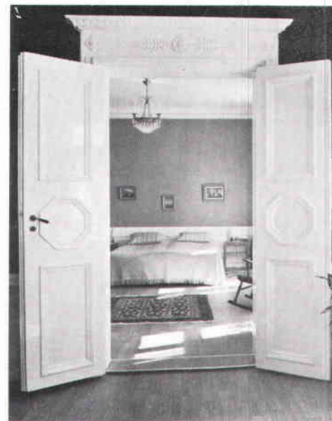
Pardörrar och överstycke i empire från 1820-talet. Drottninggatan 8 (Johannes Större) Huset uppfört redan på 1640-talet.