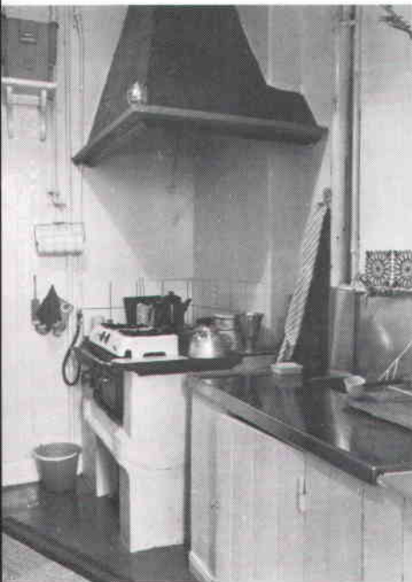
Kök i gårdshuset till Sturegatan 44 B (Hjorten 19). Huset uppfört 1880.

Att vara inventerare innebär inte bara att stöta på ett antal mer eller mindre intressanta hus — utan fastmer också att träffa på ett tvärsnitt av den svenske