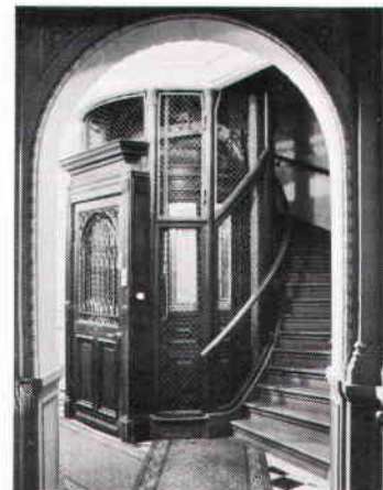
Stockholms troligen äldsta hiss, Hovslagargatan 5 B (Käpplinge- holmen 1). Huset uppfört 1887—88.

En grundlig byggnadsinventering av den typ stadsmuseet utför kan visa att även många till synes anonyma hus bakom en senare tids utslätade fasad kan dölja äldre interiörer av betydande kulturhistoriskt intresse och värde. Det finns hus som är flera hundra år äldre än vad en hastig blick på fasad och trapp-