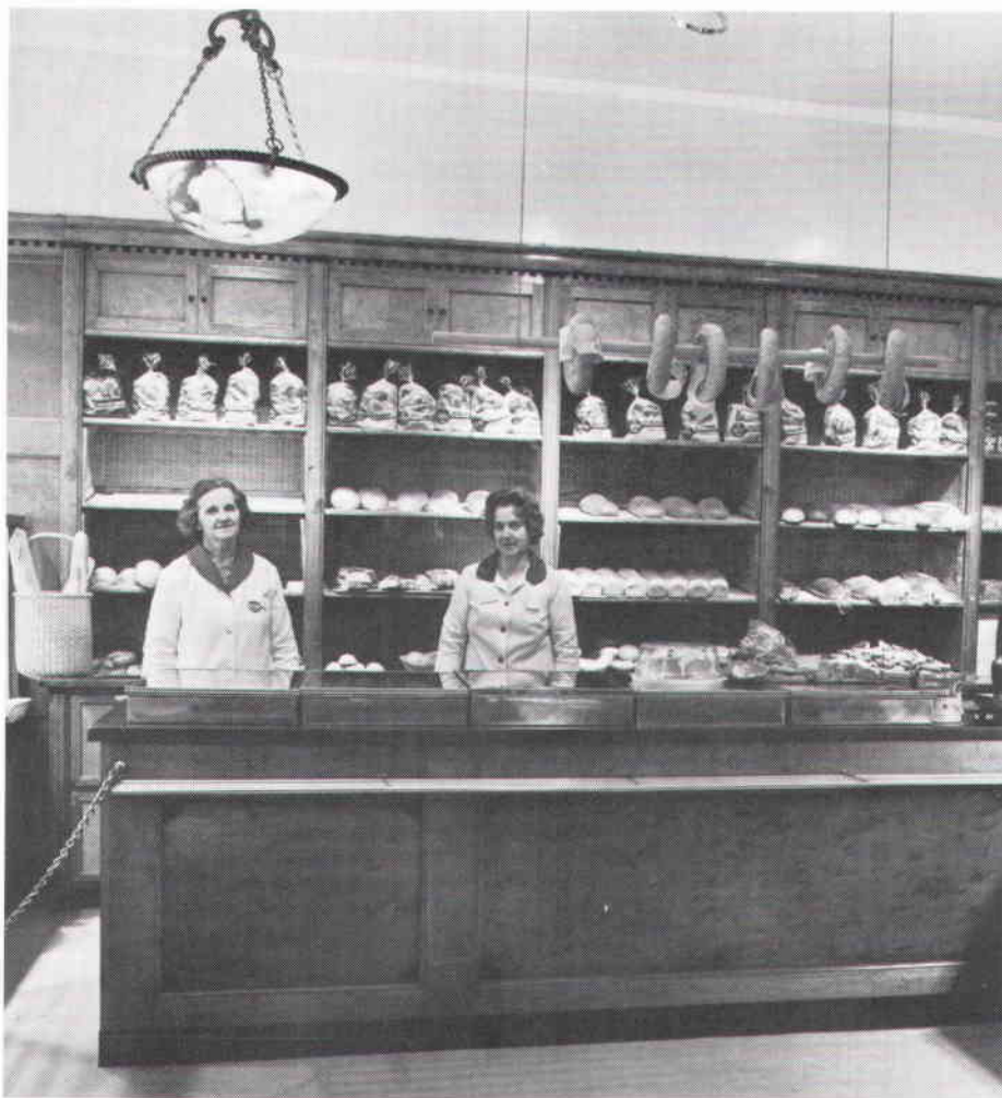
Karstens brödbutik, Mäster Samuelsgatan 52 (Blåmannen 5). Inredningen tillkom 1930.

Brandförsäkringskontor, där brandförsäkringshandlingar sedan 1746 finns bevarade. Dessa handlingar innehåller noggranna beskrivningar av byggnader, som upprättades vid de tillfällen ägaren önskade en ny försäkring eller ville förhöja försäkringsvärdet vid t ex en ombyggnad. Ytterligare en viktig källa är den sk Westinska samlingen i Uppsala universitetsbibliotek, som utgörs av fastighetsbeskrivningar från 1700-talet och tidiga 1800-talet och är utförda av rådhusrätten för att ligga till grund för värdering i samband med belåning eller inlösen. Studiet av litteratur och äldre bildmaterial samt pressklipp m m i museets arkiv bidrar till belysandet av en fastighets byggnadshistoria.