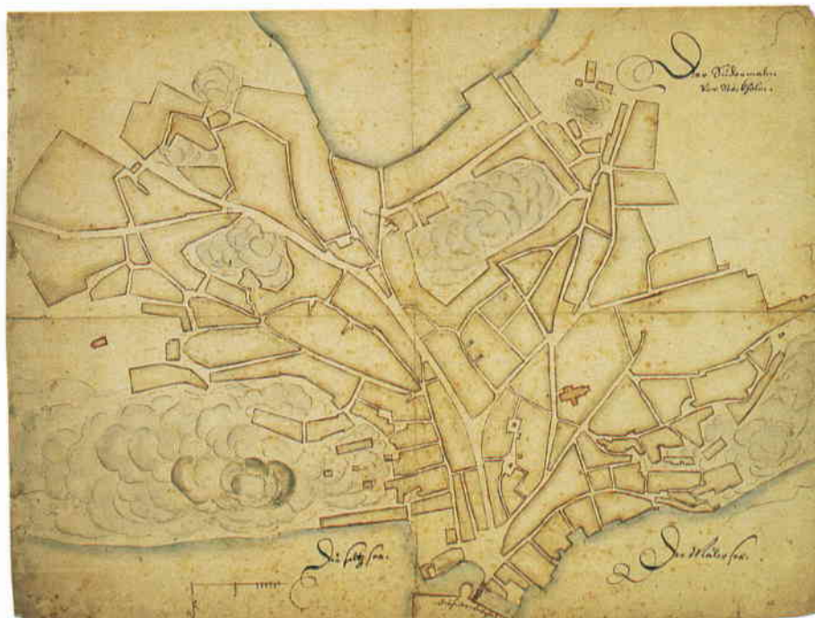
Till vänster: Del av Sigismund Vogels kopparstick från 1600-talets mitt. Söder var den stadsdel som reglerades sist, gatunätet hade växt fram efterhand och formade oregelbundna kvarter. Ovan: Södermalm före 1642. Norr är nedåt på bilden. Den breda vägen i mitten är Allmänningssvägen, första delen av Götalandsvägen, delvis i samma sträckning som nuvarande Östgötagatan. I Krigsarkivet.

vuxit och hur den sett ut under olika skeden vet vi ganska lite om. I senare källor talas om Södermalm som ett område för kålgårdar och bete åt den boskap som stadens borgare höll här. Vid sidan om denna funktion måste det ha funnits bebyggelse på malmen under nästan hela medeltiden. Den bro som sammanband Stadsholmen med Södermalm finns belagd sedan 1280. Vi känner till ett antal offentliga byggnader som exempelvis Mariakapellet från 1300-talets mitt. Helga kors kapell fanns redan 1330 någonstans i området strax väster om nuvarande Katarina kyrka. Yttre Söderport och vallgraven kom till på 1500-talet som ett resultat av de oroliga tiderna och maktstridig-