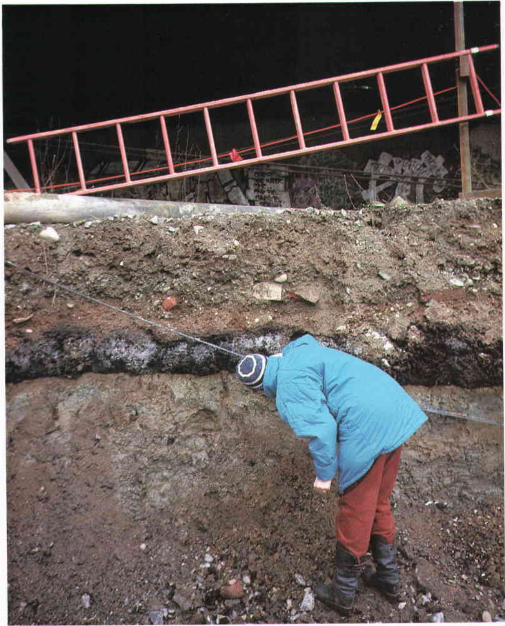
När saluhallen byggdes vid Medborgarplatsen kom Fatbursjöns torvlager i dagen. I dessa kunde kvartärgeologer ta prover och avläsa hur landskapet utvecklats från stenålder fram till att sjön fylldes igen på 1850-talet.