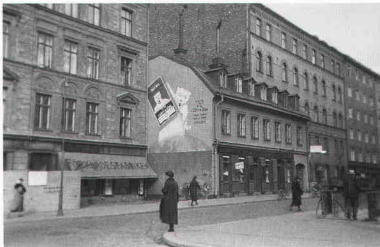
Förklädesfabrikens adress var 1928-32 Nybrogatan 35. Foto 1932.

re middag, köpte förkläden till sina hembiträden. December och januari var bra försäljningsmånader. En vanlig sort som såldes då hade infälld spets eller brodyr på bröstlappen.