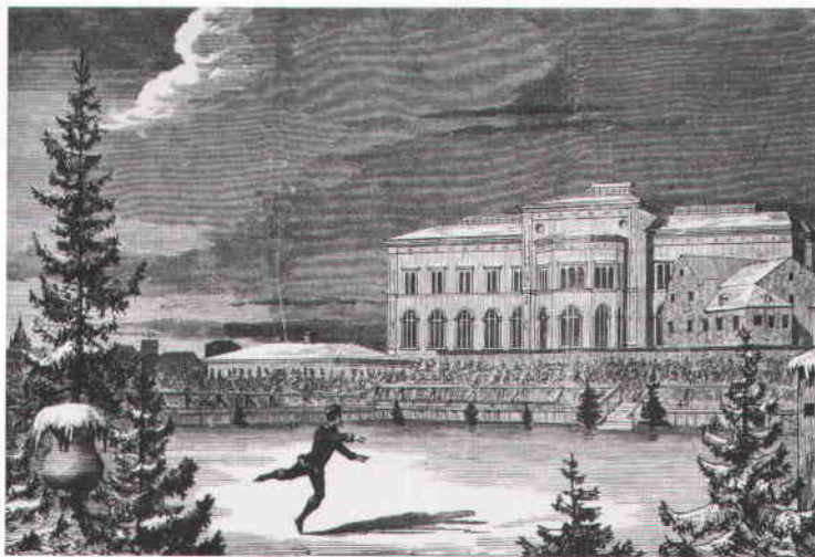
Amerikanen Jackson Haines uppträder inför publik till förmån för Decemberfonden, med uppgift att samla pengar till ett stockholmskt universitet. Uppvisningen ägde rum i inhägnaden bakom det sk Sillhovet – och Nationalmuseum. Xylografi efter teckning av Knut Alfred Ekwall. Ny Illustrerad Tidning 26 januari 1867.

Under tiden höll de verkliga skridskoentusiasterna till inne i Djurgårdsbrunnsviken. Sporrade av Per Henrik Lings romantiska friluftsideal och gymnastiska krigsövningar sökte man återuppliva götiskt mannamod och vikingarnas framfart. Bättre rustade än skridfinnar och andra hade man sedan 1830-talet tillgång till den moderna järnskridskon. Smått legendariska blev de studenter vilka 1857 skrinat från Uppsala till Stockholm. Redan på 1870-talet anordnades tävlingar med "naturkonståkare" och från 1880 fick man låna Stockholms Roddförenings båthus och pontonbrygga. Inte bara att skridskoåkning ansågs som ett uppfriskande, hälsosamt och angenämt vinternöje, så mycket mer som det kvinnliga elementet kom till och förskönade tillvaron, här kunde även den – i socialdarwinistisk tolkning – naturliga tävlingslusten komma till uttryck. Fram-