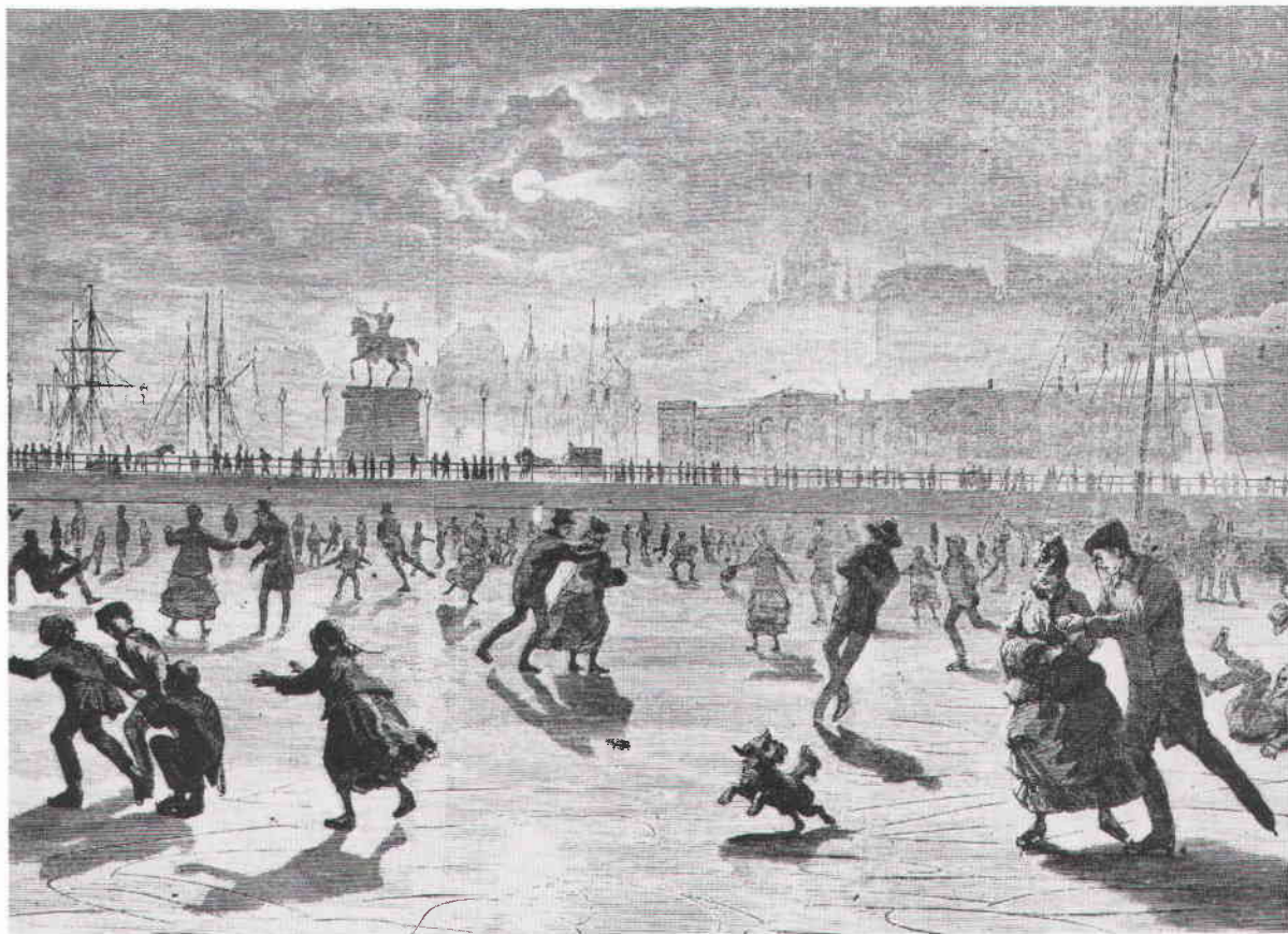
Svenska vinternöjen: Mälarisen i månsken. Xylografi efter teckning av Knut Alfred Ekwall. Ny Illustrerad Tidning 2 april 1870.

avlöstes av världsmästerskap med Ulrich Salchow som ny svensk stjärna. Under tiden ägnade sig hastighetsåkarna åt Europamästerskap på distanserna 500, 1 500, 5 000 och 10 000 meter. Kung Borens nyckfullhet försämrade dock emellanåt isförhållandena, varför arrangörerna i stället började nyttja Idrottsparkens (den blivande Olympiastadions) och Östermalms Idrottsplats fasta och spolade banor. Inte desto mindre bidrog tävlingarna på Nybroviken till att göra skridskoåkningen till en nationell folksport.