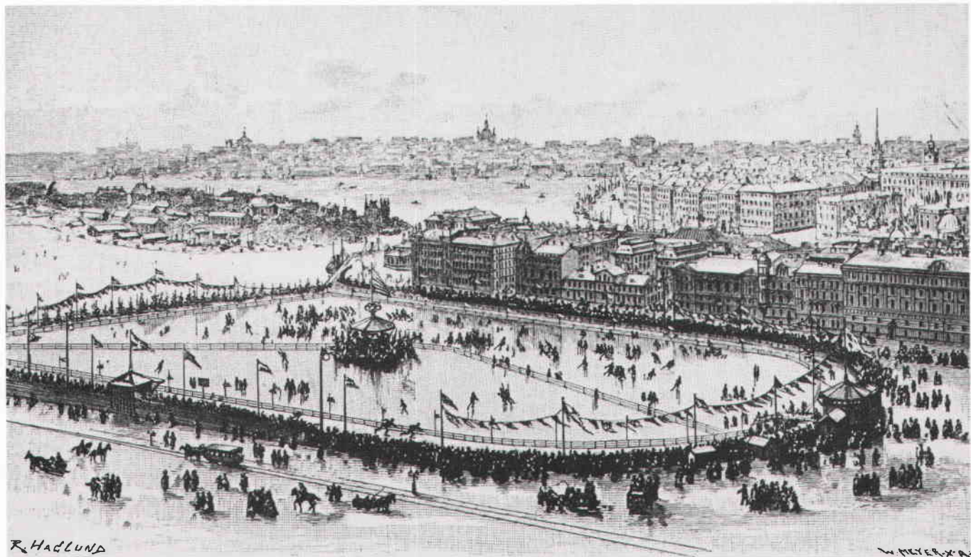
Nybrovikens skridskobana som den såg ut 1895. Utefter kajerna trängs åskådare. På löparbanan pågår hastighetsåkning. Ett staket särrar figuråkare från nöjesåkare. Teckning av Robert Haglund (förmodligen efter ett fotografi) och xylografi av Wilhelm Meyer.

gerliga offentlighetens utveckling. I takt med marknadsekonomins utbredning växte det fram en ny kulturell överbyggnad, där medelklassen umgicks och meddelade sig med varandra. Detta vid sidan av den ceremoniella hovkulturen och den politiska maktens statsoffentlighet, det som utgjorde överhetens kommunikationssammanhang. Som komplement till isoleringen i den borgerliga intimsfären uppstod ett till marknadsekonomi orienterat kulturliv. Bland annat etablerades teatrar, varietéer, musikkaféer, galanteributiker och mondäna promenadstråk. Sommartid flanerade man i Kungsträdgården, ”lekte