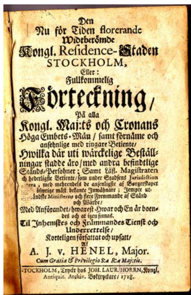
Den nu för tiden florerande...