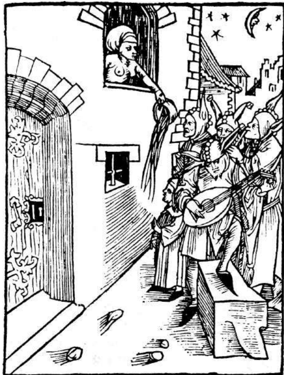
Under medeltiden och långt fram i nya tiden kunde viss renhållning gå till så här!

så att en djup brunn grävdes vilken överst försågs med ett stort vinfat för att hindra skred. När gropen inte rymde mer fyllde man igen den på natten, ty »dylikt grovt arbete måste försiggå i hemlighet». En ny grop grävdes tätt intill, ett nytt vinfat sattes dit och det »lilla huset» flyttades över till sitt nya bo. När det stora husets invånare vaknade såg de med förundran, att det »lilla huset» hade flyttat på sig några tuffjär. På så vis blev gården undan för undan genomsållad med gömda och glömda hemligheter, hemligheter som gjorde sig påmind när sommarvärmen blev för stark. Det sista alternativet var att, när nöden så krävde, kalla på »Natmandens» hjälp för att få gården uppresad.