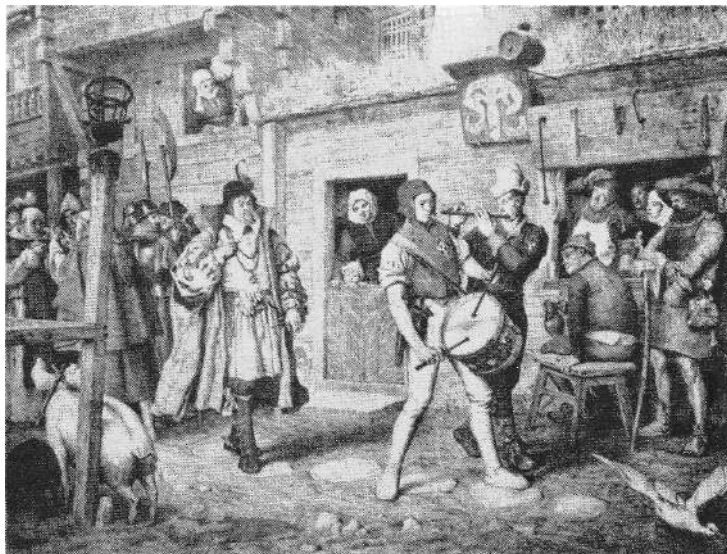
Stadsgata på 1520-talet. (Efter teckning av G v Rosen.)

(de böcker där styresmännens beslut bokfördes) ofta tätt på varandra följande uppmaningarna att sköta gaturenhållningen. I tänkeboken för 1573 förekommer sådana uppmaningar minst sex gånger. Bötesstraffen för försummad renhållning ökade också successivt vid upprepat slarv.