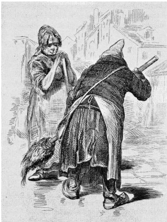
Renhållningshjon efter en teckning 1844.