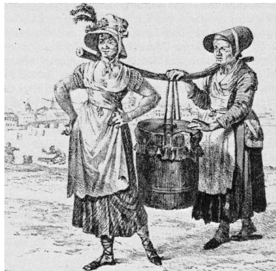
Latrinbärerskor på 1820-talet. (Efter litografi av C W Svedman.)

I beslutet ingick att det blev två urlastningsstäl-