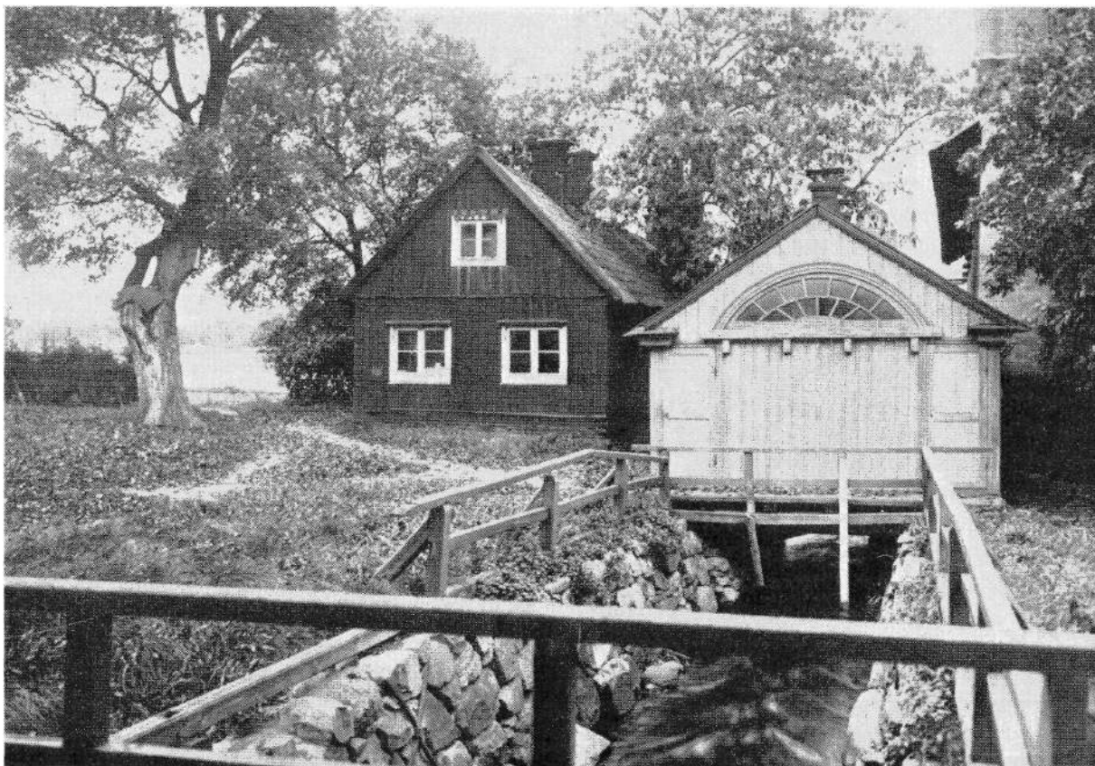
Avtråde över rinnande vatten vid Danvikens hospital omkring 1900,

gas, holländaren borde utvisas ur staden. Denne hade emellertid ingen tanke på att ge vika för den allmänna meningen, och när en av borgmästarna beordrade honom att ge sig av vägrade han och begärde att få besked om varför staden inte ville ha honom kvar.