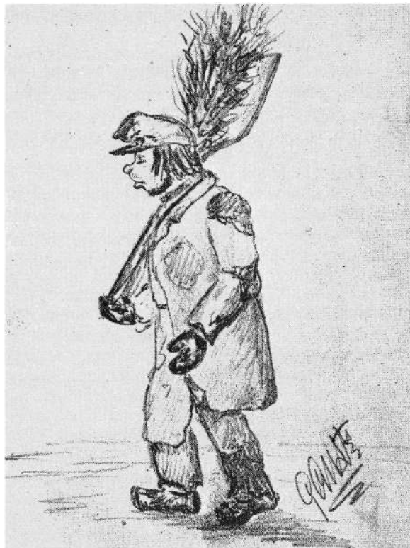
Renhållningshjon omkring 1850, (Efter teckning av G Cronstedt.)

kasern vid Träskgatan (denna låg intill nuvarande Birger Jarlsgatan norr om Engelbrektsplan).