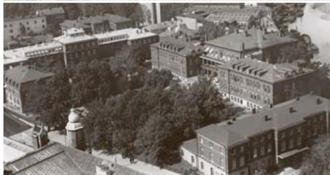
HISTORISK MARK. Överst, sjuksal på Serafimerns medicinklinik. Teckning utförd av Selma Ljungberg i Svea 1894. Unders sjukhusområdet, omkring 1930-35