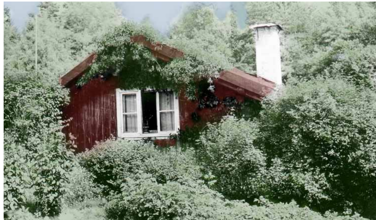
Torpet Lugnet. Foto: A Boström, 1930. Bromma Hembygdsförenings arkiv.

Torpet Lugnet är knuttimrat. Det större rummet, som också användes som kök, har en öppen spis med bakugn vilken nu är igenmurad. Kammaren har en vacker kakelugn hopsatt av kakel från två 1760-talskakelugnar. Stugan brann 1976 men restaurerades. Parboden, nordöst om torpet, är byggd omkring år 1700 men hitflyttad 1936 från Igeltorp i Salems socken. Från samma socken kommer också logen som stått vid Rosendals gård. Den har här fungerat som samlingslokal för den flickscoutverksamhet, som från 1932 bedrevs vid Lugnet.