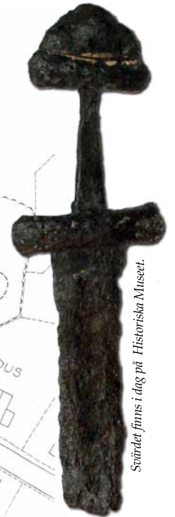
Svärdet finns i dag på Historiska Museet.