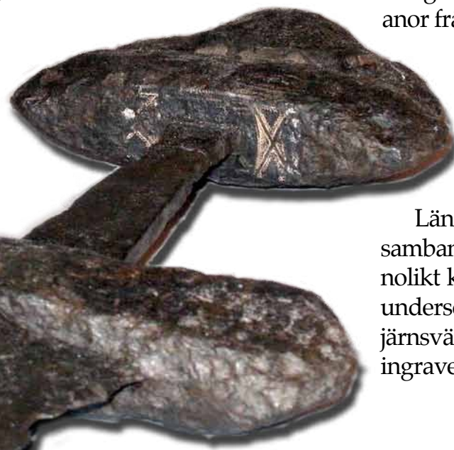
Svärdet har spår av silverinläggning på fästet.

Mellan kärnen låg ett starkt rostskadat smycke, en halsring av järn, försedd med flera mindre ringar. Efter undersökningen återställdes gravan.