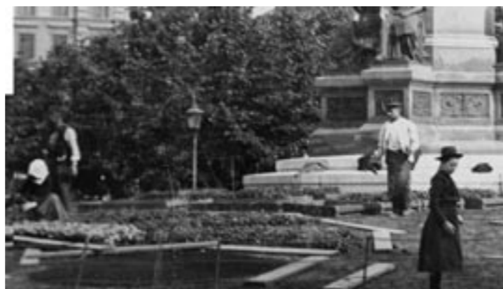
Planteringsarbete i slutet av 1800-talet