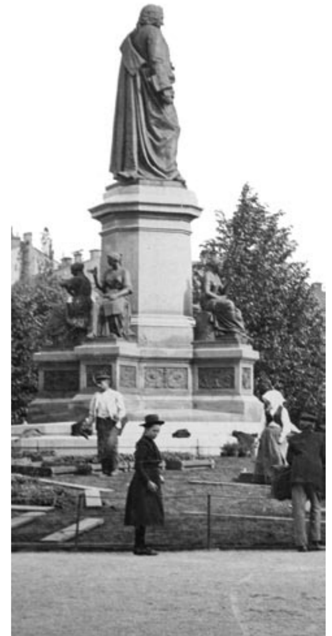
Planteringsarbete i slutet av 1800-talet