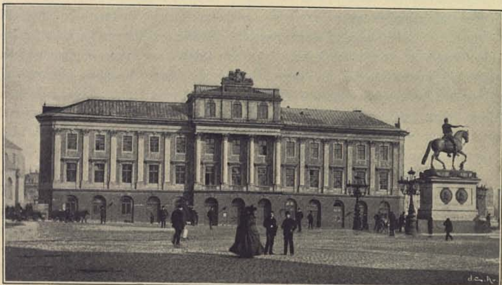
142. Gamla operahuset.

Vid den tiden var det nya kungl. operahuset redan färdigt och invigdt, och publiken skänkte i synnerhet det sin bevägenhet. Det hade uppförts på den tomt, som förut intagits af det s. k. större De la Gardieska huset, hvilket uppförts i medlet af 1600-talet och nu inköpts af öfverståthållaren, friherre Carl Sparre, som öfverlät äganderätten till konungen, hvilken lät rifva ned huset och uppdrog åt öfverintendenten, friherre C. F. Adelerantz att uppgöra ritning och kostnadsförslag för att på den platsen uppföra ett