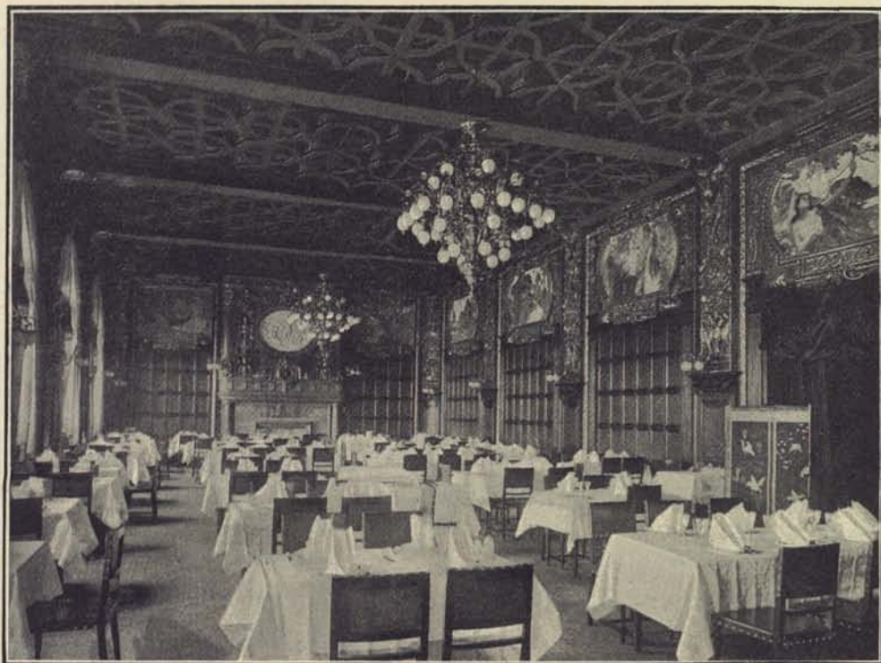
133. Operakällarens matsal.

Det gamla Ludvigsro har undergått många förändringar, innan det blef den nya Hasselbacken, och allt fortfarande göras tillbyggnader af det stora värdshuset, vidtagas förbättringar, ökas planteringarna, men därmed ökas ock hindren för den fria utsikten, hvilken förut var så oinskränkt öfver Stockholm och en god del af omgifningarna. Blicken från verandan kan numera ej tränga långt omkring, men verandan själf är rymligare, bekvämare, mera inbjudande än förr, och det lif som där föres är mera storstadsaktigt, mera europeiskt, kan man säga, något som kan ställas i jämbredd med vår