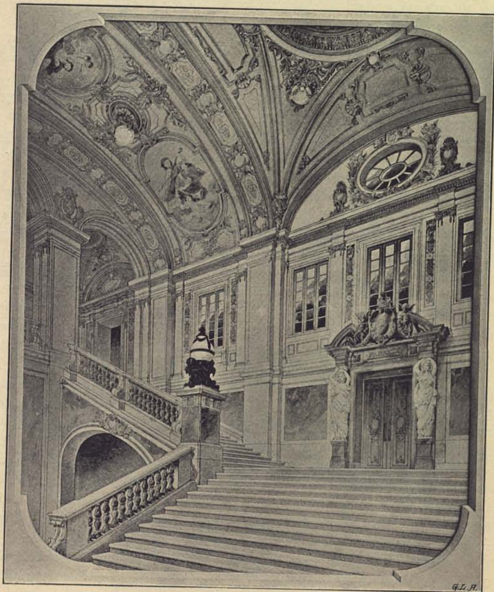
145. Nya operahuset, hufvudtrappan.

De för konungens räkning i första radens plan belägna rummen utgöras af ett kupolhvälfadt entrérum; en salong med tunnhalv och försedd med tre