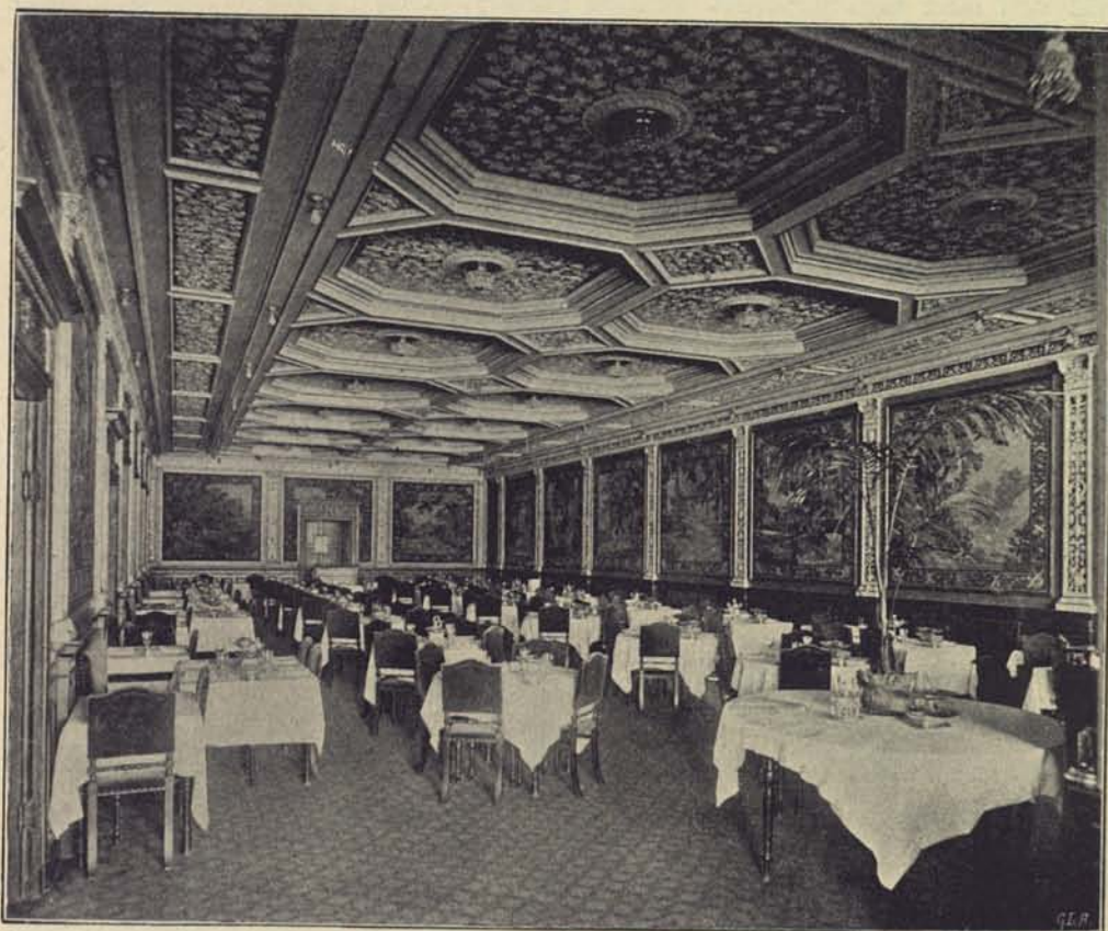
136. Hótel Rydbergs matsal.

Största antalet af ogifta arbetare intager dock sina måltider på »bolags-