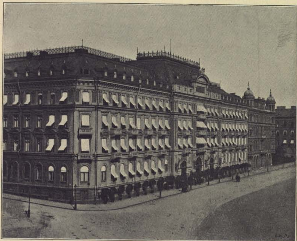
140. Grand Hôtel.

I främsta rummet ha de förlustelser, lika »gamla som gatan» och på gatan hemmahörande, gycklare och spelmän af lägre grad. Men dessas verksamhet är numera ganska begränsad. Det är endast här och där på gårdarna man kan någon gång få se en och annan akrobat och »konstmakare». Gatans musikanter äro också förvisade till gårdsplatserna, men