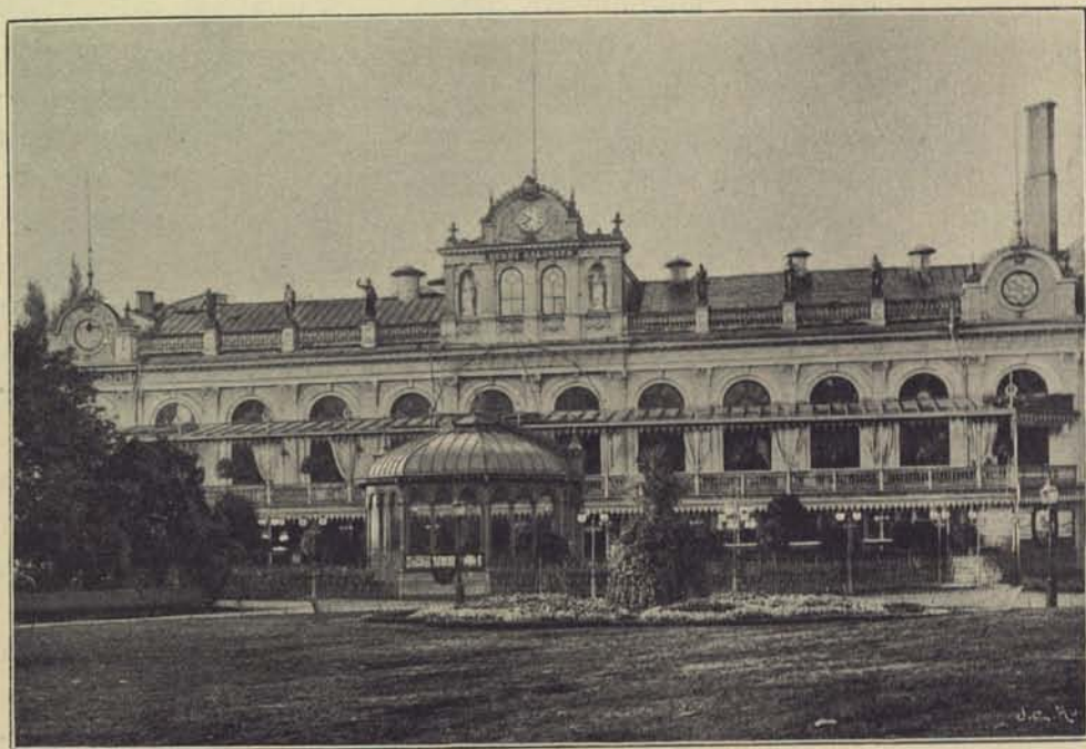
138. Berns salong.