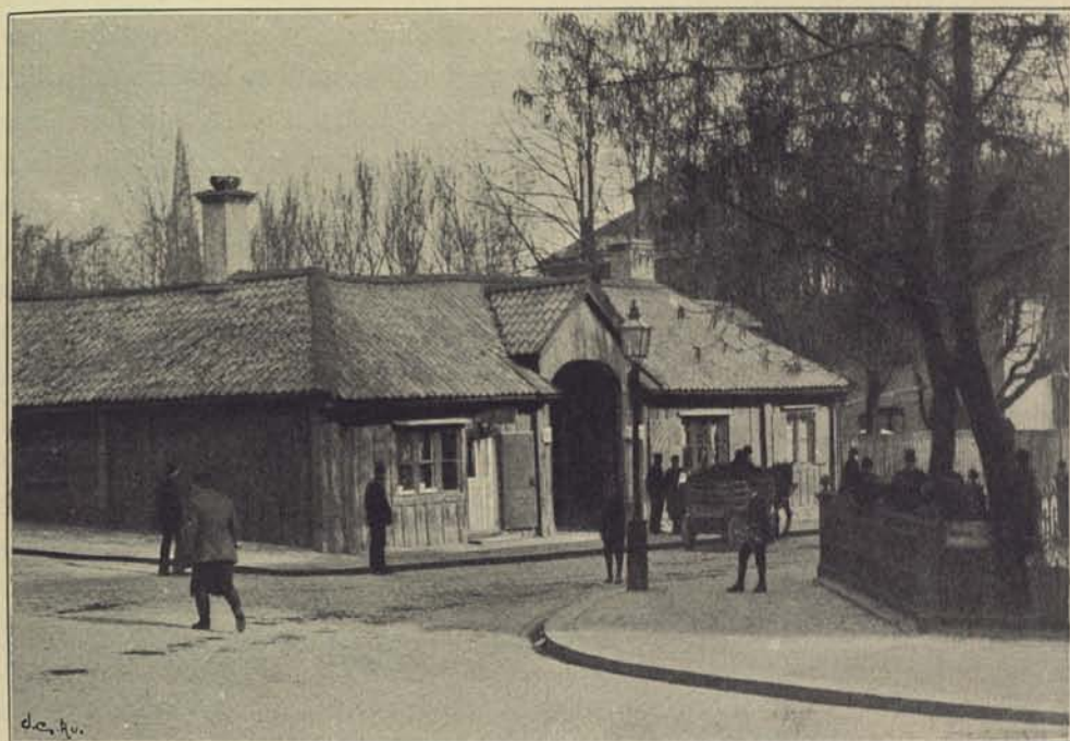
137. Kaféet »Petissan».

Några nykterhetskaféer äro tämligen stora och besökas endast af de bildade klasserna. Det äldsta af dessa är »Tysta Marias kafé» vid Regeringsgatan, hvilket hela året igenom och hvarje stund på dagen betjänar ett