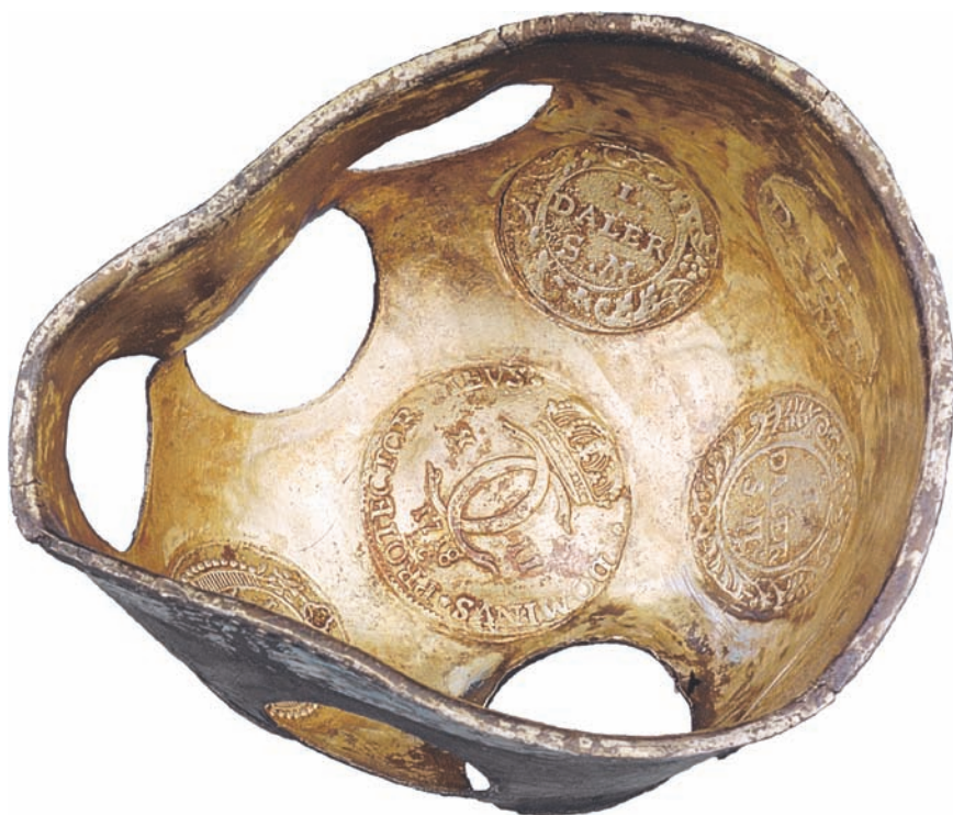
Ovan: Bägarnas insida.

Artikelförfattare: Kerstin Söderlund och Helena Fennö