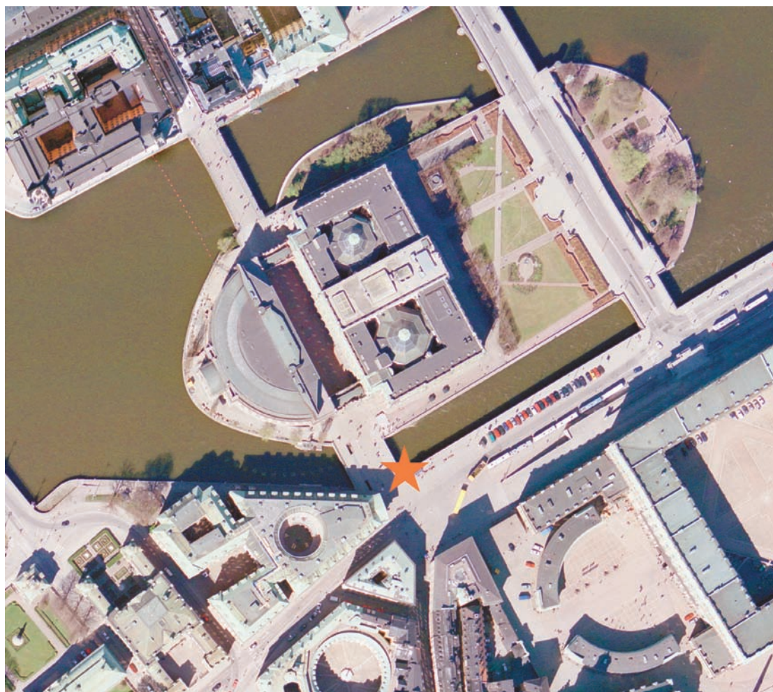
Fyndplatsen för bågaren markerad på ortofotokartan

De mynt som sitter på bågarens buk är nödmynt. De utgavs för att finansiera de allt kostsammare krigerna och för att sätta upp en ny armé. Det var med denna armé som Karl XII i oktober 1718 tågade över norska gränsen mot fästningen Fredriksten, där han senare blev skjuten. Bland befolkningen var nödmynten mycket impopulära, eftersom de var präglade i koppar, men skulle gälla för en daler silvermynt. De var de första kreditmynt som utgavs i Sverige och de skulle inlösas «wid beqwämligare tider». Nytt var också att några av mynten hade inskrifter på svenska vilket inte förekommit tidigare. Tio olika typer av nödmynt utgavs och de präglades alla i Stockholm under åren 1715–1719. Mynten kallades ibland för «Görtzdaler» efter baron Georg