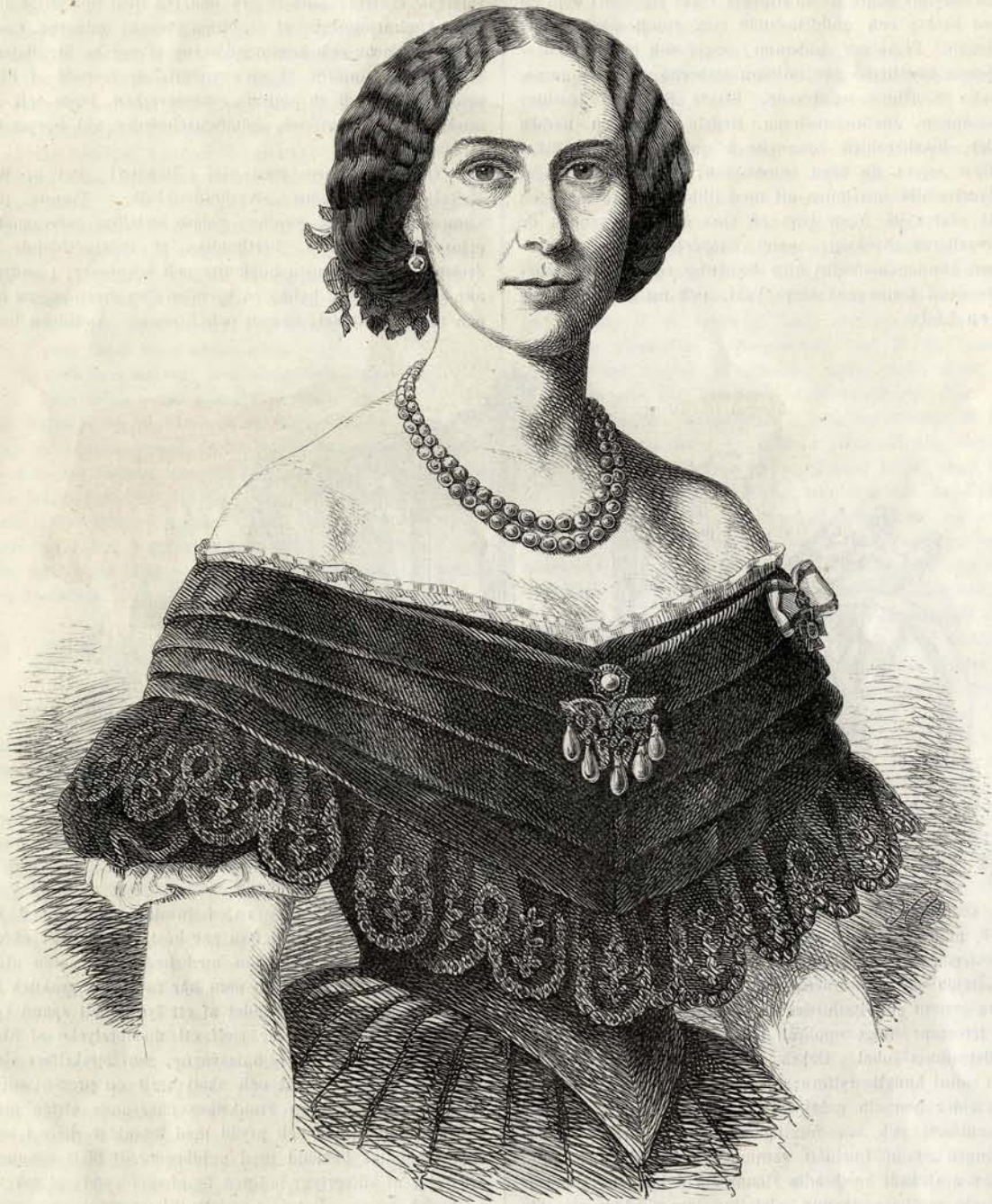
WILHELMINA FREDRIKA ALEXANDRA ANNA LOVISA, DROTNING AF SVERGE OCH NORGE.