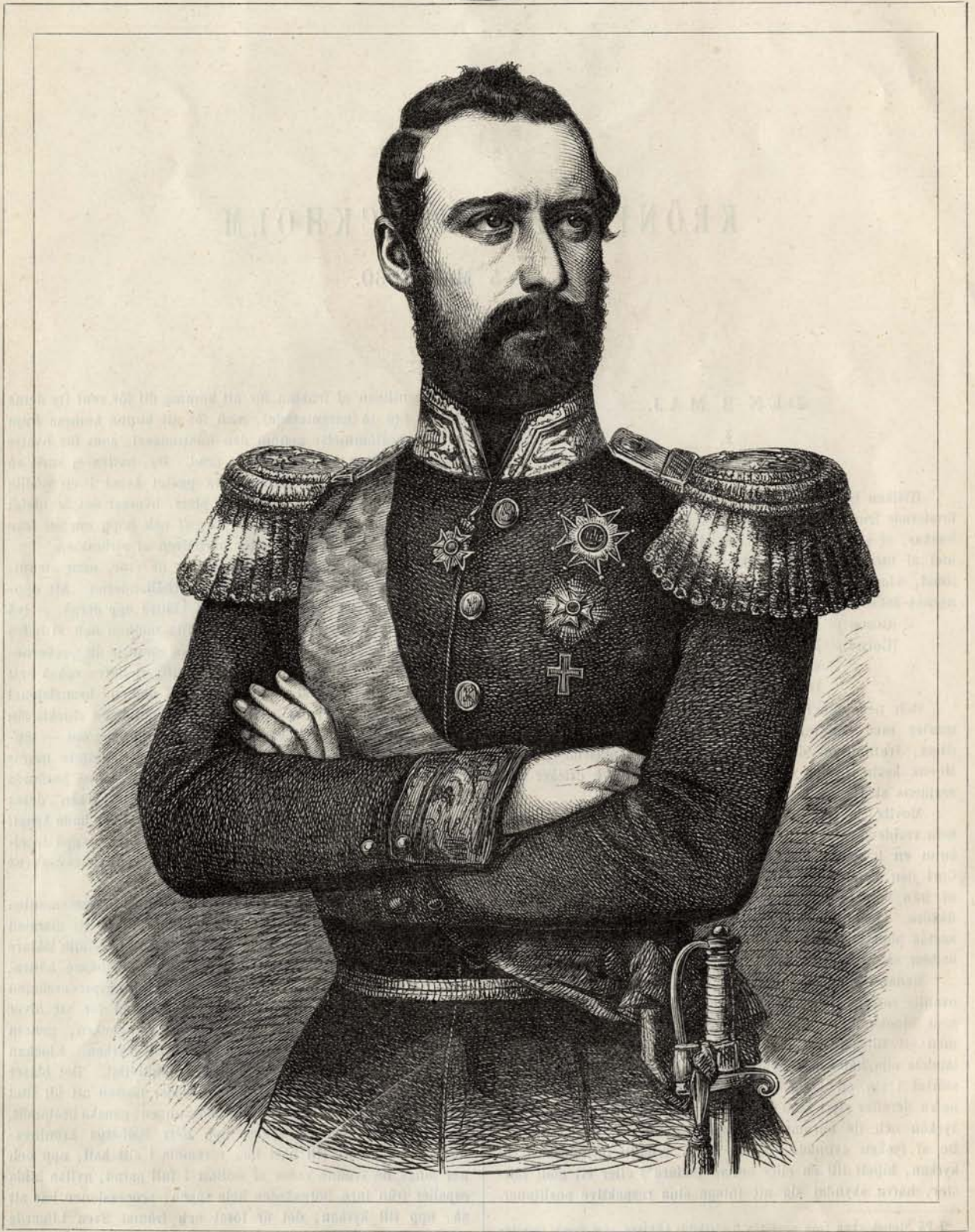
CARL XV LUDVIG EUGÈNE, SVERGES OCH NORGES KÖNING.