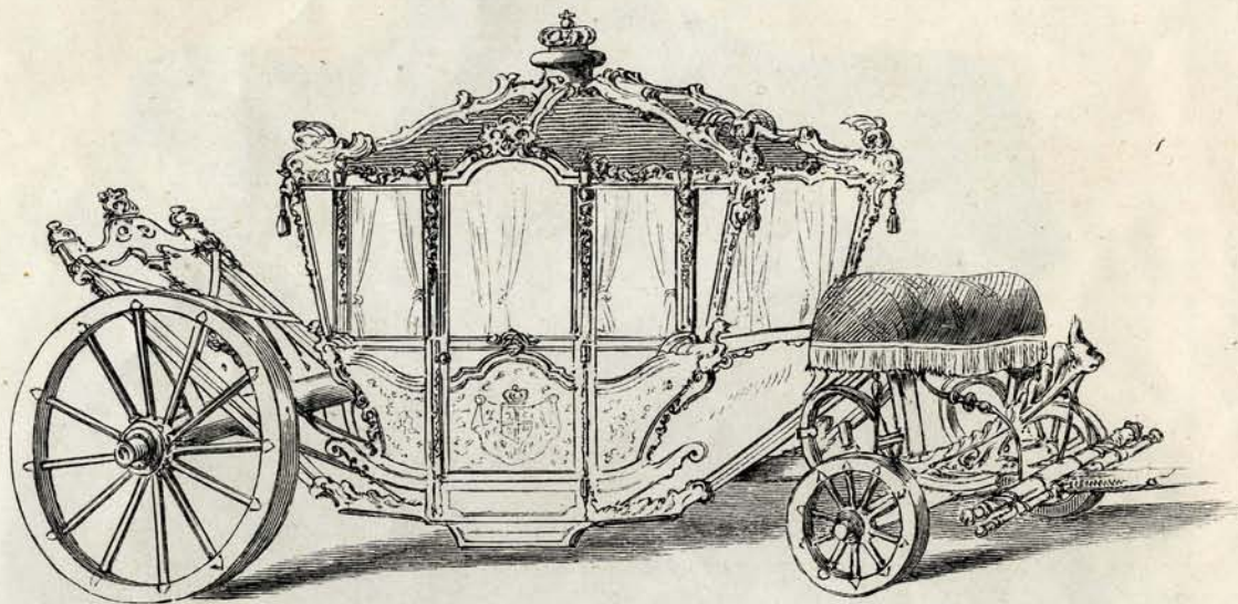
DROTTNING CHRISTINAS VAGN.

Nu — en herre med staf i handen! Det är Hennes Majestät Drottningens öfverhofmarskalk. Tvenne modiga »hingstridare» följa derefter, vidare åtskilliga galavagnar med prinsessan Eugenie, hertiginnan af Östergöthlands, samt drottningens förnämsta hofdamer och kavaljerer; i andra vagnar åka de herrar, hvilka på hyenden föra drottningens mantel och regalier (Äpplet, Spiran och Kronan). Ändtliga hafva vi